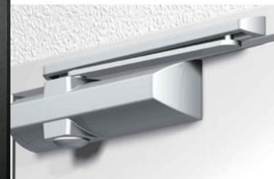
*Opcional mola aérea