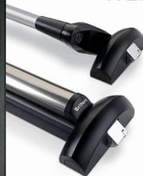
*Opcional barra antipânico